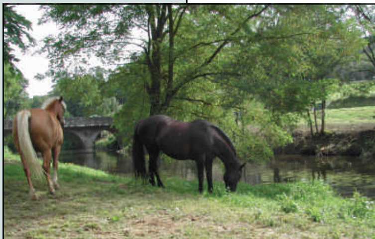
Nos pâturages, souvent constitués de délaissés, deviendraient ils à nouveau intéressants pour l'agriculture....?