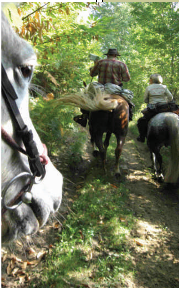
Rando tranquille rythmée par le pas des chevaux ... Au fait ... C'est quoi un casque ?...

Pour répondre à cette obligation de moyen, l'association doit être en mesure de prouver qu'elle a vérifié l'existence de la RC du cavalier, par exemple sur la liste des participants établie au départ ou par la réponse à l'invitation sur laquelle seront portés nom de la compagnie et n° de contrat, une fausse déclaration du participant dégageant la responsabilité de l'association. En effet, celle-ci n'est tenue qu'à une obligation de moyen et non de résultat qui pourrait l'obliger à enquêter sur la véracité des déclarations.